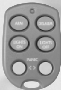
option KR21 art. no. 09169